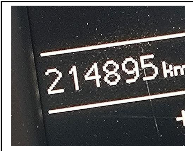
查驗當日里程數 214895 KM