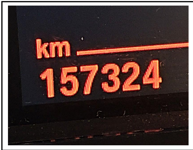
查驗當日里程數 157324 KM