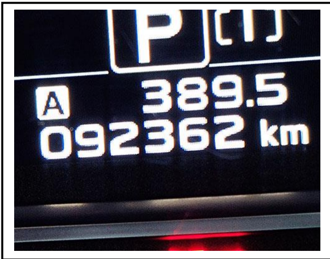
查驗當日里程數 92362 KM