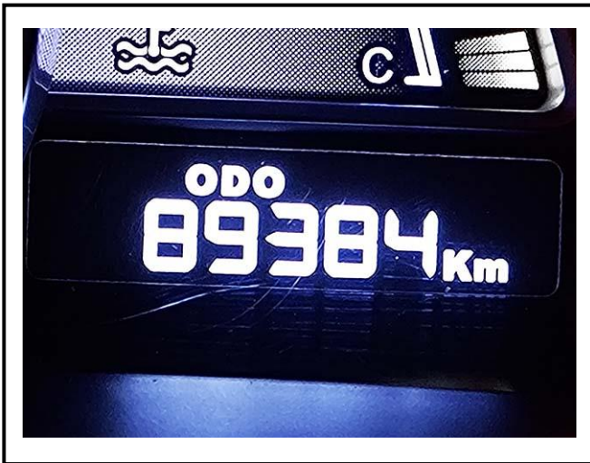
查驗當日里程數 89384 KM