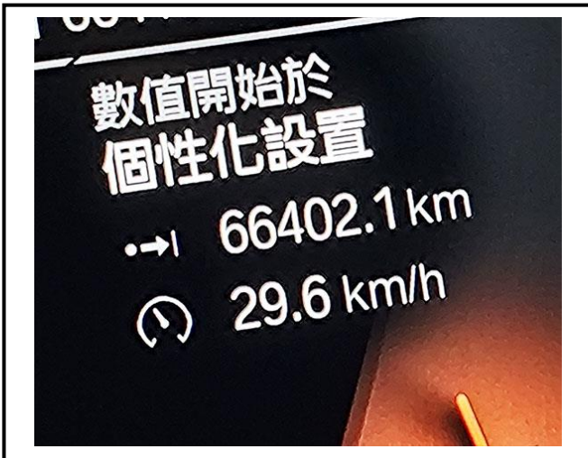
查驗當日里程數 66402.1 KM