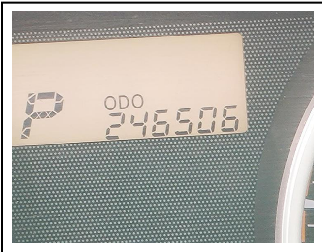
查驗當日里程數 246506 KM